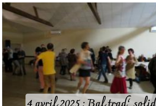
4 avril 2025 : Bal trad' solidaire à Chein-Dessus, 100 personnes