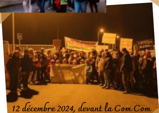
12 décembre 2024, devant la Com Com